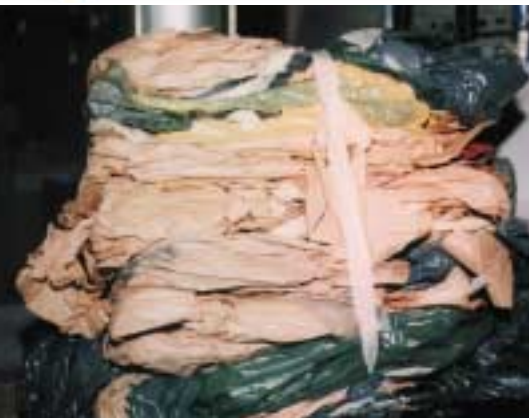
MATERIAL PROCEDENTE DEL ENMASCARAMIENTO EN UN TALLER DE PINTURA Y CHAPA

de los procesos, así como cada uno de los residuos producidos en los mismos, ampliando la información para los residuos considerados tóxicos y peligrosos, también se acompañará documento acreditativo de la aceptación de cada RTP por el gestor o gestores autorizados. Estos gestores autorizados son aquellas empresas reconocidas por la Administración para realizar la retirada de los RTP a los diferentes destinos, dependientes del tratamiento al que deberán de estar sometidos. La aceptación de estas industrias en el Registro supone su autorización como pequeños productores de RTP.