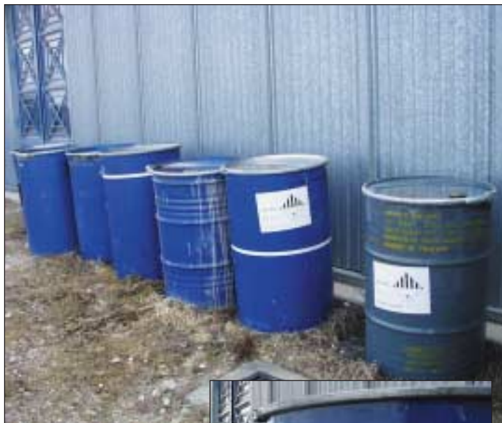
ENVASADO DE RTP

Dentro del régimen jurídico que regula la producción, se establece que todas aquellas actividades generadoras o importadoras de residuos tóxicos y peligrosos están sometidas a autorización previa, que ha de solicitarse al Órgano Competente de