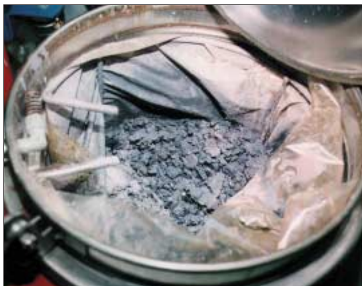
RESIDUO SECO DE LOS DISOLVENTES DE PINTURA

La documentación que debe acompañar a la instancia de solicitud constará de un informe en el cual se describirán cada uno