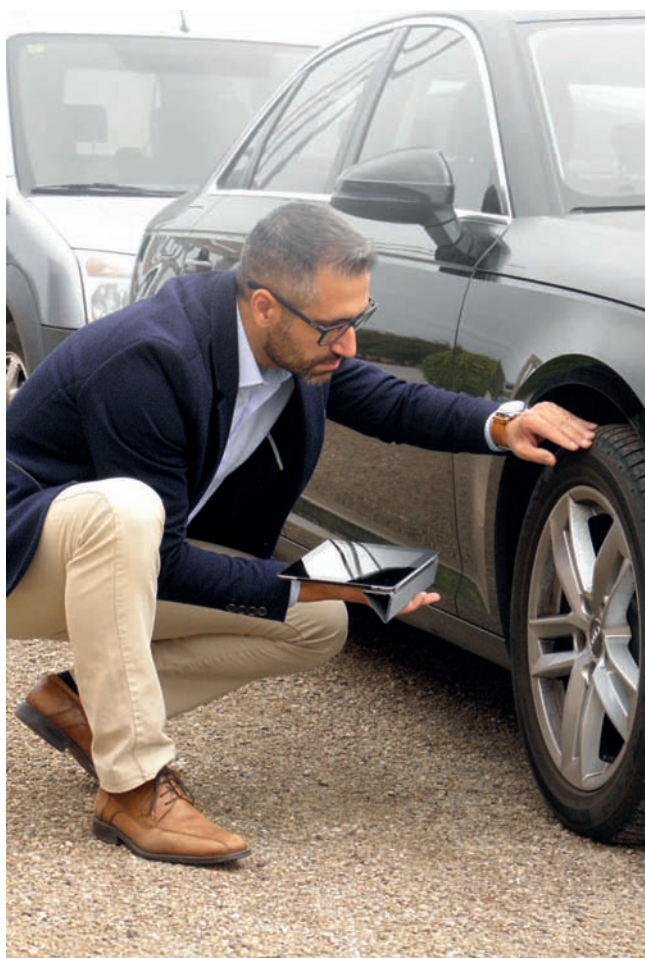
Perito de Seguros de Automóviles.

A lo largo del tiempo Centro Zaragoza ha cubierto vacantes en su plantilla con trabajadores que previamente se habían formado en sus aulas.