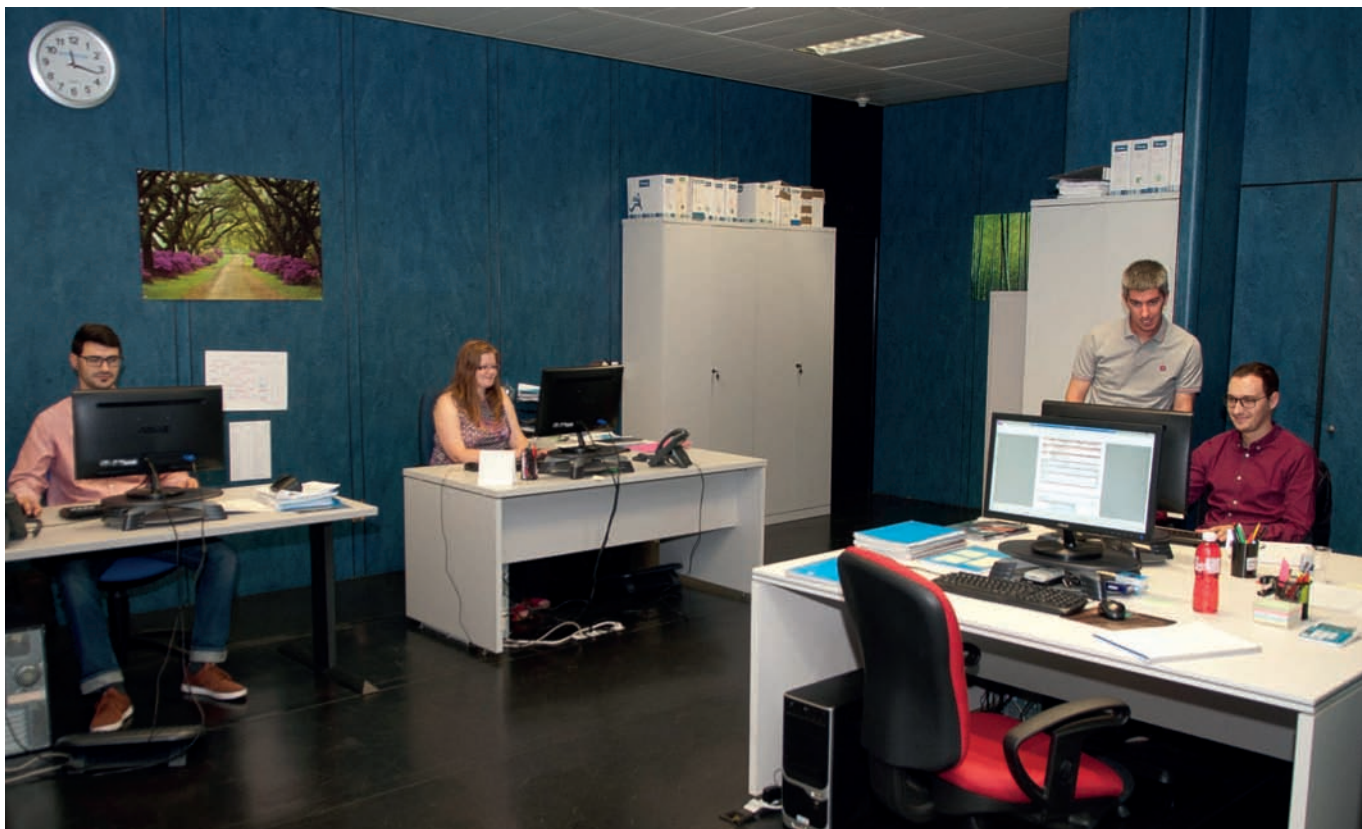
Técnicos del departamento de Reconstrucción de Accidentes de Tráfico de Centro Zaragoza.

En la actualidad, los talleres de reparación de vehículos tienen plantillas con perfiles profesionales definidos y diferentes entre ellos. En la estructura de empresa del taller encontramos las figuras de jefe de taller, jefe de sección y asesor de servicio. Cada una de ellas con competencias diferentes y cuya consecución está relacionada con el desarrollo de las tareas del resto de miembros de la estructura. Estos perfiles profesionales requieren de una serie de aptitudes determinadas. En el caso de los jefes de taller y jefes de secciones, una de las competencias más valoradas es la peritación de vehículos, dado que entre sus tareas está la valoración económica de la reparación del vehículo. Dicha valoración es fundamental para la gestión de los procesos de trabajo y para el control de consumo de materiales. Por otro lado, es imprescindible tener la valoración hecha de manera correcta cuando el Perito de la Compañía Aseguradora llega al taller, con el objeto de contrastar las dos valoraciones y mantener una comunicación al mismo nivel. Por último, en determinados casos y dependiendo de la compañía aseguradora, los talleres peritan los daños del vehículo directamente y envían el informe a la compañía, donde un Perito revisa y, si corresponde, autoriza dicha peritación.