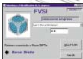
HOJA TIPO DE TRANSMISIÓN DE DATOS DE VEHÍCULOS SUSTRÁIDOS Y LOCALIZADOS DEL CIRV.