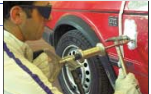
TIPOS DE ARANDELAS DEL MIRACLE SYSTEM