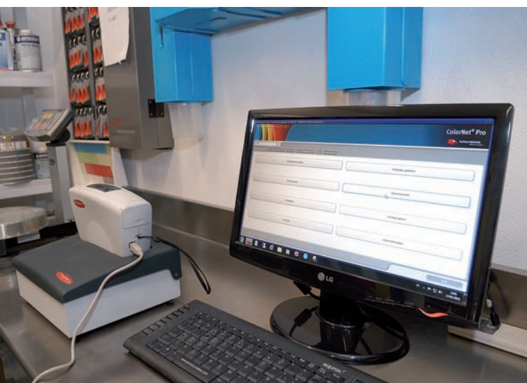
Conexión del espectrofotómetro al programa de gestión.

Parece que las marcas de pinturas están apostando por el desarrollo de esta herramienta y son ya muchas las que disponen de ella para la medición "electrónica" del color del vehículo, si bien, por el momento, no son muchos los talleres que cuentan con ella. Su funcionamiento es muy sencillo, facilitando y agilizando la tarea de búsqueda del color. Tras calibrar el equipo y tomar las lecturas sobre el vehículo o vehículos a repintar, se conecta el espectrofotómetro al programa y se descarga la información recogida. Además de la tecnología del equipo de medición, algo fundamental es la Base de Datos del programa. Con los datos recogidos el programa muestra un listado de los códigos de color que más se aproximan al color buscado, cuantificando la proximidad y pudiendo, incluso, reformular para un mayor ajuste según indicación del programa.