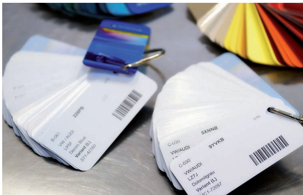
Cartas de color.