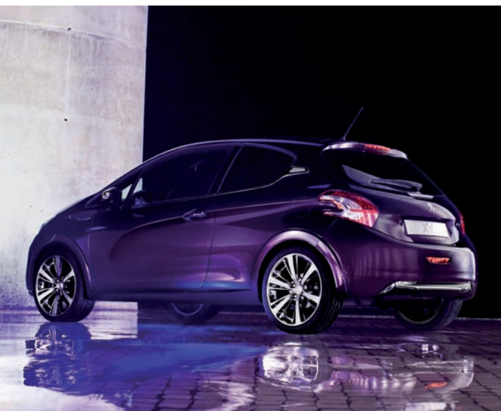
Peugeot 208 XY

Para comenzar, la gama de motores gasolina, ofrece un 1.0l VTi con potencias de 70CV y 82CV. Este ligero motor gasolina, junto al 1.2 THP, cuentan con tres cilindros, y el sistema Stop & Start. Estos últimos motores llegan a desarrollar hasta 136CV. Su ligereza y una reducción de las emisiones de CO 2 , son otras de sus ventajas.