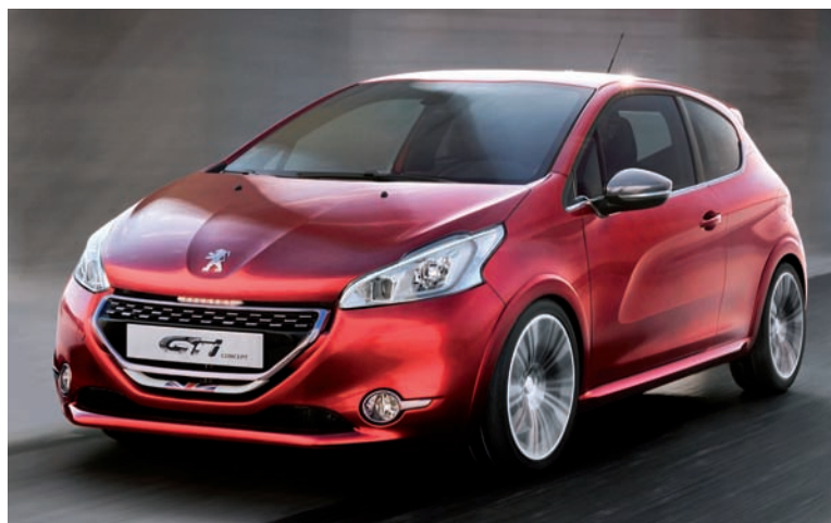
Peugeot 208 GTI

El apartado multimedia viene de lo mas completo contando con: Bluetooth, Peugeot Connect, radio CD MP3, puerto USB, pantalla táctil de siete pulgadas y entrada auxiliar de audio.