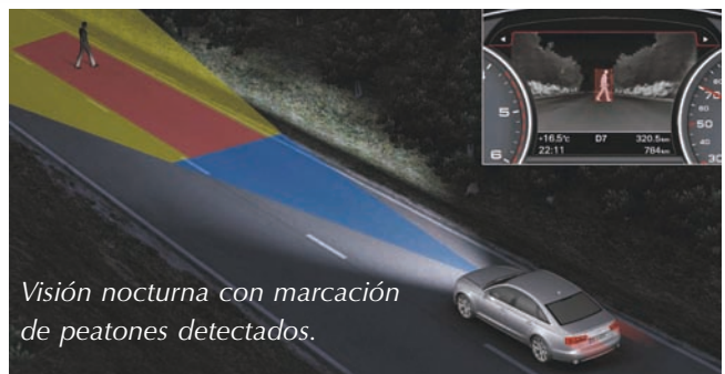
Visión nocturna con marcación de peatones detectados.

El placer de conducción y la eficiencia están garantizados.