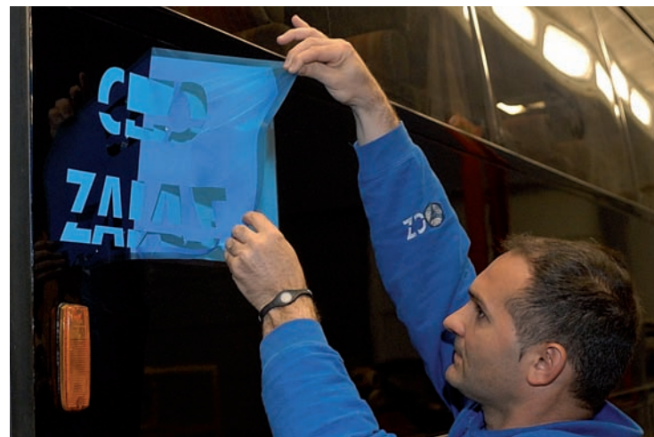
Retirada del vinilo.

se da por concluido el trabajo. Sin embargo, si se trata de un diseño con letras o terminaciones muy finas que comprometen el matizado, ya que es fácil dañar los límites marcados por el vinilo, se suele emplear un sellador sobre la superficie descubierta sin matizar, y a continuación se aplica en húmedo sobre húmedo el acabado.