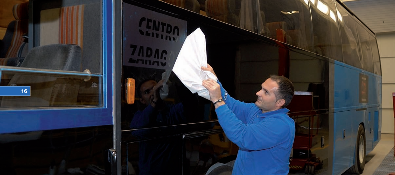
Retirada del soporte que cubre el vinilo.

Ejecución del diseño.- La lámina de vinilo que sirve de máscara se coloca previamente en la superficie para marcar dónde se quiere aplicar. Se retira el papel de protección de la parte con adhesivo y se pega en la superficie marcada. Es importante que quede perfectamente adherido, para evitar que la pintura se infiltre bajo la lámina y se difuminen los contornos del diseño. A continuación se procede a ir retirando las secciones recortadas o a retirar el soporte que cubre todo el vinilo (según máscara) para ir descubriendo las partes que recibirán pintura. Para garantizar un buen resultado es preciso cerciorarse de que no quedan restos del adhesivo del vinilo en las zonas descubiertas, por lo que debe limpiarse y desengrasarse con cuidado dichas zonas. Por último, se enmascara alrededor del vinilo para proteger las zonas que no han de recibir pintura.