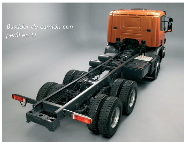
Bastidor de camión con perfil en U.

Las dimensiones y espesores de los bastidores de cabina son menores que los vistos anteriormente, y apenas superan los 3mm de espesor y los 2m de longitud.