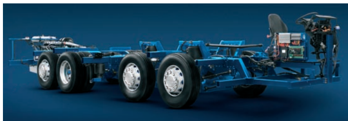
Conjunto chasis- bastidor de un autobús.