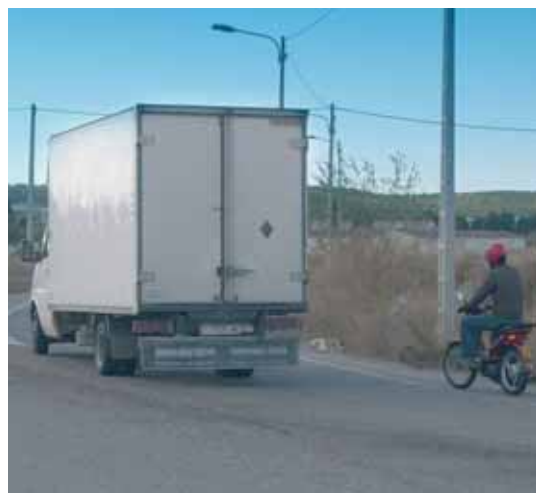
Los ciclomotores también deben circular por el arcén

Excepcionalmente, cuando el arcén sea transitable y suficiente, los ciclomotores podrán circular en columna de a dos por éste, sin invadir la calzada en ningún caso. Los ciclomotoristas no pueden circular por autopistas y autovías.