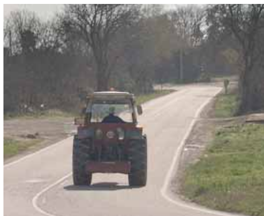
En este caso no existe arcén suficiente y el vehículo agrícola debe circular utilizando la parte imprescindible de la calzada

Además hacemos referencia a los vehículos agrícolas, ya que estos son considerados vehículos especiales y por lo tanto también deben circular, siempre que exista y sea transitable, por el arcén. La circulación de estos vehículos por el arcén entraña un riesgo añadido, ya que su anchura supera en todos los casos a la anchura del arcén y por lo tanto invaden, necesariamente, una parte del carril contiguo.