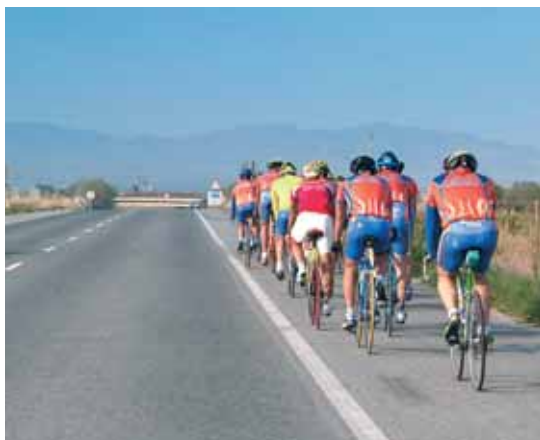
Los ciclistas deben circular por el arcén en columnas de a dos

La mayoría de los accidentes de ciclistas se producen en las vías en las que no hay arcén o el mismo es prácticamente intransitable. Hay que mejorar la seguridad vial para los ciclistas pero además hay que hacer los arcenes transitables.