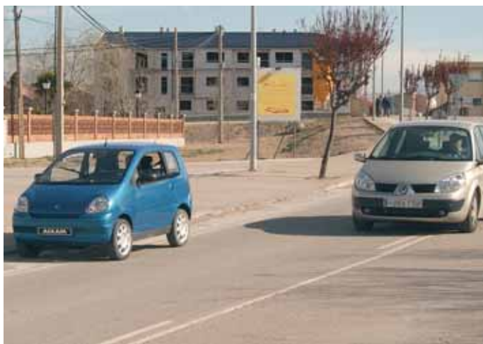
Los cuatriciclos ligeros, deben circular por el arcén, siempre que éste sea transitable y suficiente

Dentro del grupo de ciclomotores se incluye a los cuatriciclos ligeros, vehículos de cuatro ruedas cuya masa en vacío sea inferior a 350 kg y cuya velocidad máxima por construcción no sea superior a 45 km/h, por lo tanto los cuatriciclos también deben circular por el arcén. Actualmente el uso de estos vehículos se ha extendido en España, y es muy común verlos circulando por nuestras carreteras. Es necesario referirnos a los mismos en este artículo, ya que en ocasiones este tipo de vehículos circulan por carreteras en las que el arcén no es transitable o suficientemente ancho, e inevitablemente tienen que invadir una parte de la calzada. Por ello ante la proximidad de cuatriciclos circulando por el arcén, el resto de conductores deben extremar la precaución y, si los adelantan, antes de iniciar el adelantamiento que requiere desplazamiento lateral, el conductor que se proponga adelantar deberá advertirlo con suficiente antelación con las señales preceptivas y comprobar que en el carril que pretende utilizar para el adelantamiento existe espacio libre suficiente para que la maniobra no ponga en peligro ni entorpezca a quienes circulen en sentido contrario, teniendo en cuenta la velocidad propia y la de los demás usuarios afectados.