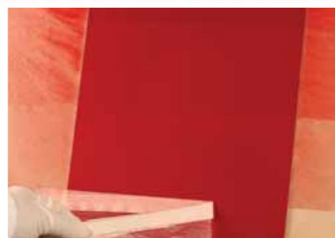
4 Se determina el número de manos de perlado a aplicar mediante una probeta. Esta se prepara aplicando el fondo base a toda la superficie, después se divide en zonas para aplicar el perlado en 1, 2, 3 y 4 manos, y se barniza. Una vez seca se compara con el vehículo.