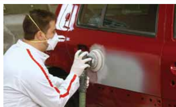
1 Una vez realizados los trabajos de fondo o preparación de la pieza afectada, se lija la zona aparejada con lija de granulometría P800 en seco.

Los acabados tricapas, con perlados puros, conllevan un mayor tiempo en la preparación y aplicación del color. En este caso concreto, se realiza la aplicación de un tricapas difuminando el color en la pieza afectada por un daño y en las piezas adyacentes para evitar problemas de igualación de color.