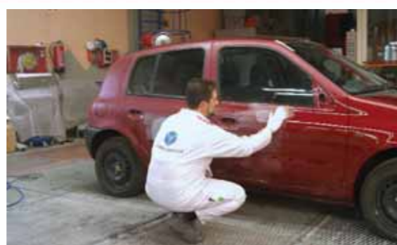
2 Se matiza el resto de la pieza afectada y las piezas adyacentes con esponja abrasiva y pasta matizante. A continuación se limpia y se desengrasa.