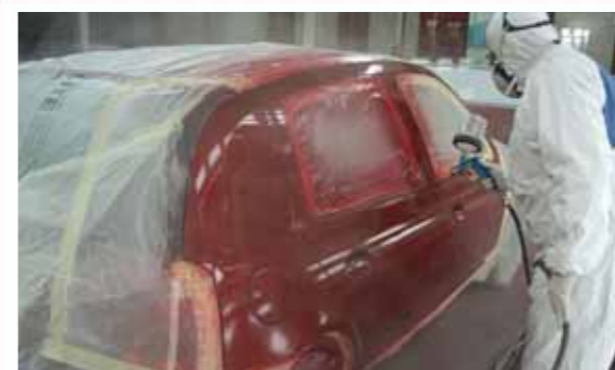
9 Se prepara y aplica el barniz a las tres piezas.