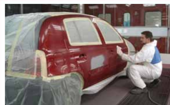
5 Se enmascaran las tres piezas a pintar y se pasa un paño atrapapolvos por toda la superficie.