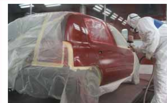
8 Se desenmascaran las piezas adyacentes y se aplica una última mano de base perlada a la pieza afectada difuminando en las piezas adyacentes.