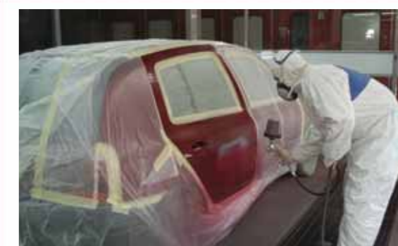
6 Las dos piezas adyacentes se cubren y se aplica el fondo base indicado en la fórmula de color a toda la superficie de la pieza afectada.