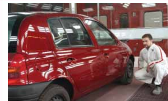
10 Por último, tras el secado del barniz, se desenmascara el vehículo y se inspecciona el resultado final.