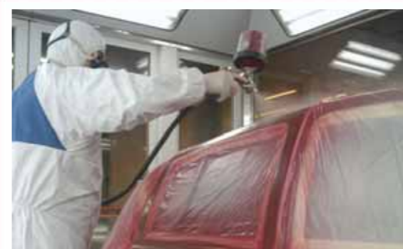
7 Se aplican las manos de base perlada necesarias, determinadas a partir de la probeta realizada, a toda la superficie de la pieza afectada.