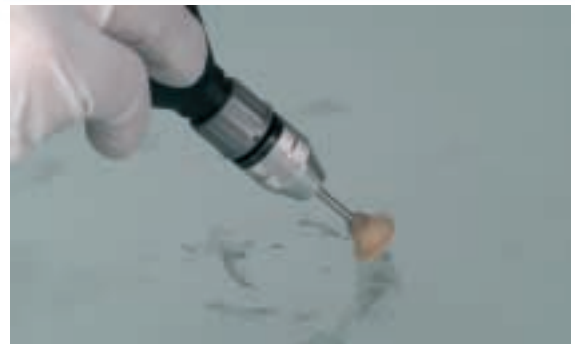
10 Acabado de la reparación. Retirar el exceso de resina y aplicar pulimento para sacar brillo a la zona.