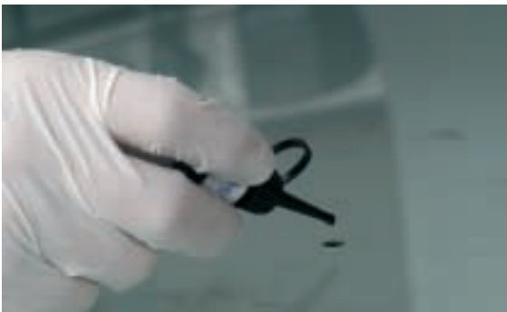
9 Acabado del punto de impacto y de los taladros aplicando resina de acabado.