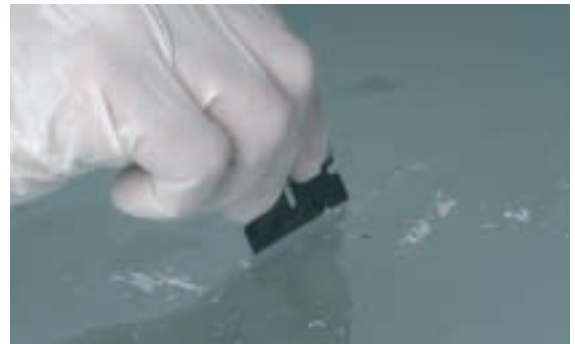
8 Retirar el exceso de resina con una cuchilla.