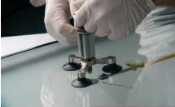
5 Reparación de los taladros. Extraer aire, rellenar con resina y colocar lámina de celofán.