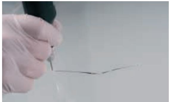
Identificación y limpieza del daño.