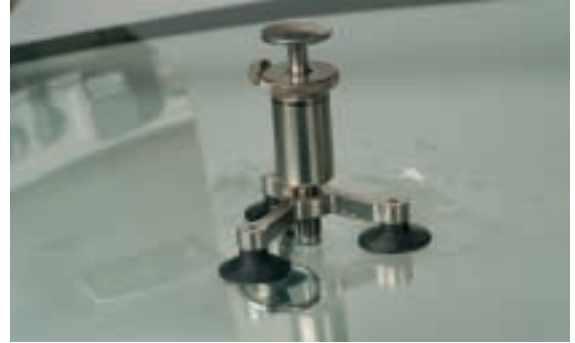
6 Reparación de la grieta. Extraer aire, rellenar con resina y colocar lámina de celofán.