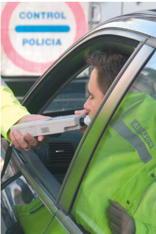
MIENTRAS ALGUNOS PAISES RESTAN PUNTOS POR COMETER INFRACCIONES, OTROS LOS SUMAN.

Este, para nosotros, nuevo sistema ya se ha introducido con buenos resultados en otros países europeos como Francia, Luxemburgo, Reino Unido, Alemania e Italia. El carné por puntos utiliza dos modelos diferentes, y mientras unos países restan puntos por cometer infracciones, otros los suman. En Francia, Luxemburgo e Italia, el sistema se basa en un crédito de puntos que se van descontando a medida que el conductor va cometiendo infracciones; mientras que en Reino Unido y Alemania el sistema penaliza acumulando puntos negativos.