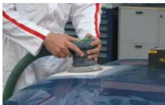
LIJADO CON ABRANET