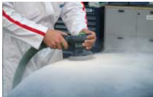
LIJADO SIN ASPIRACIÓN