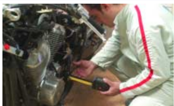
4 Centrado del eje comprobador