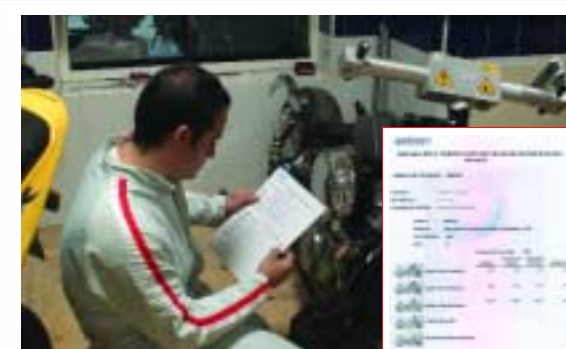
9 Informe de las dimensiones obtenidas, comparándolas con las originales