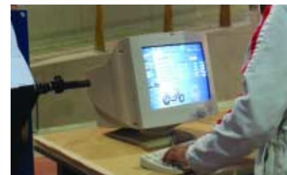
8 Comprobación en el programa informático de las dimensiones obtenidas en la medición respecto a las originales facilitadas por el equipo