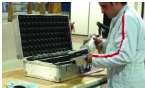
1 Preparación del equipo

La verificación de un chasis de una motocicleta se puede realizar correctamente por medio de equipos verificadores láser, que comprueban las cotas del chasis determinando si han sufrido o no alguna deformación.