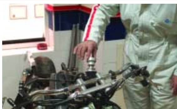
3 Colocación de los accesorios y del equipo