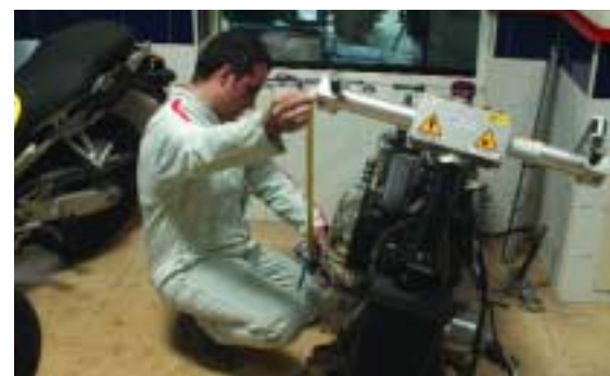
7 Medición de la distancia entre el eje de la pipa y el eje del basculante