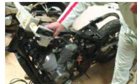
6 Medición del ángulo de avance