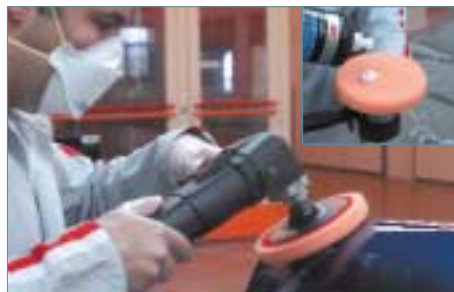
Desbastador de Corte Rápido 09374 Pulidora a 1700 r.p.m. Boina de desbastar