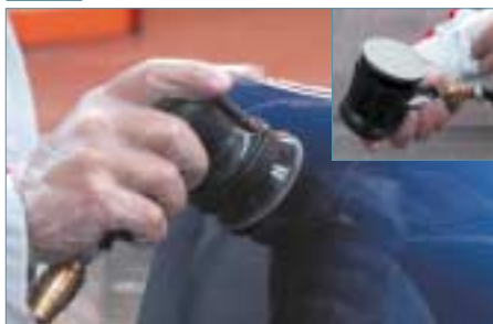
Trizact P3000 Lijadora roto-orbital con interfase Con agua jabonosa