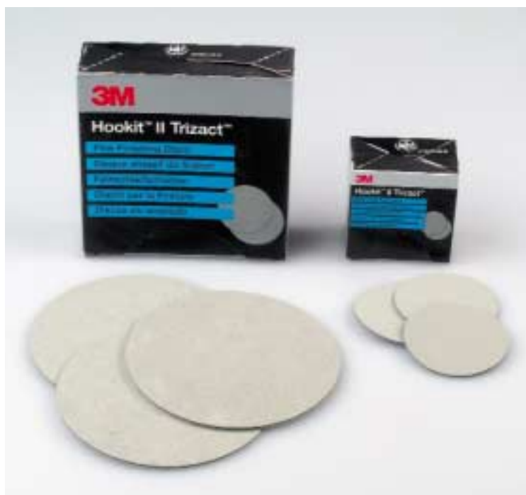
Microabrasivo Trizact en varios formatos

Alta calidad de acabado unido a una reducción en los tiempos