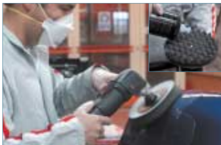
Abrillantador 09376 Pulidora a 1700 r.p.m. Boina de abrillantar

NOTA: En seco procurar evitar el embazamiento de las lijas con frecuentes sopladitos sobre las mismas y sobre la pieza, ya que pueden provocar marcas de lijado.