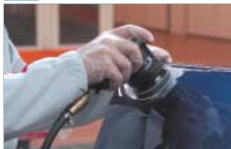
260L P1200/P1500 Lijadora roto-orbital con interfase En seco o con agua jabonosa*