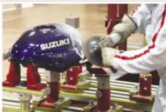
Anclaje del depósito.